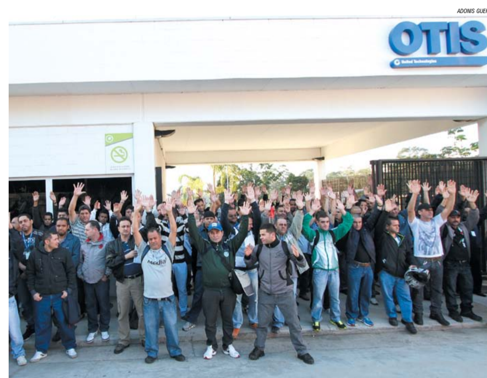
Companheiros votam durante assembleia na Otis