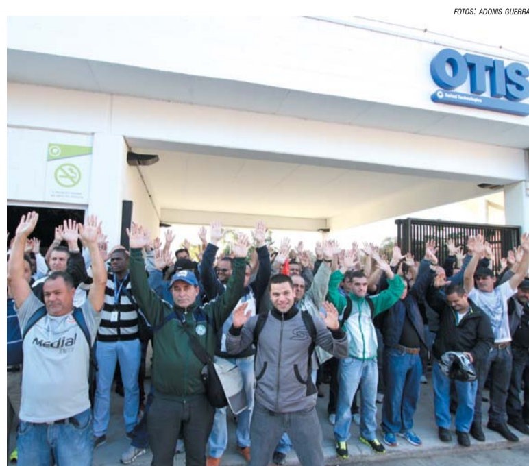
Trabalhadores durante assembleia

Segundo o dirigente, foram cinco rodadas de negociações até a aprovação da